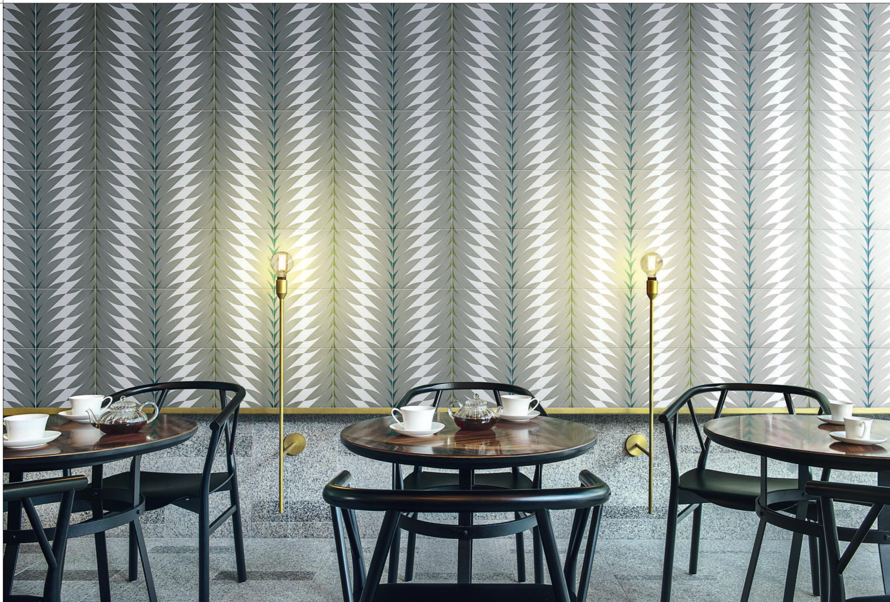
CONTRACT, FLEURS 4A-4B Rivestimento posa a campo pieno / Covering, all over layout