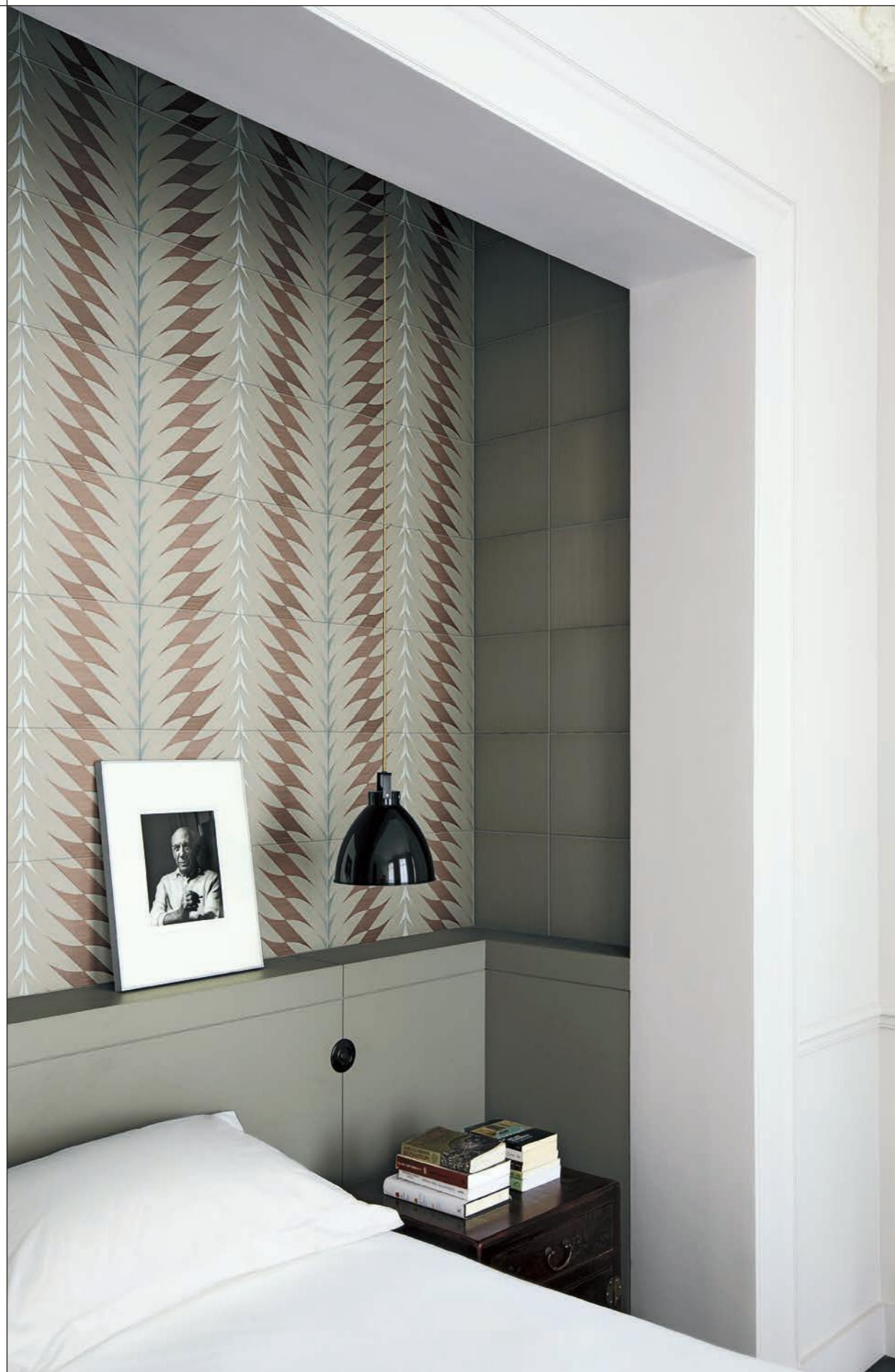
CONTRACT, FLEURS 2A-2B-2F Rivestimento posa a campo pieno / Covering, all over layout