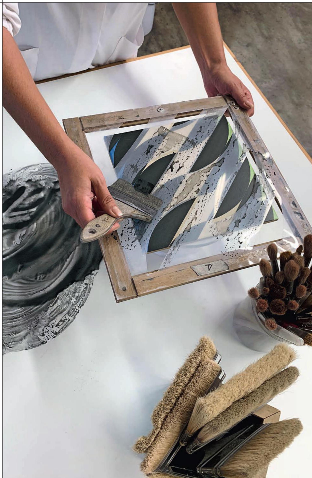
PENNELATO A MANO / HAND PAINTED