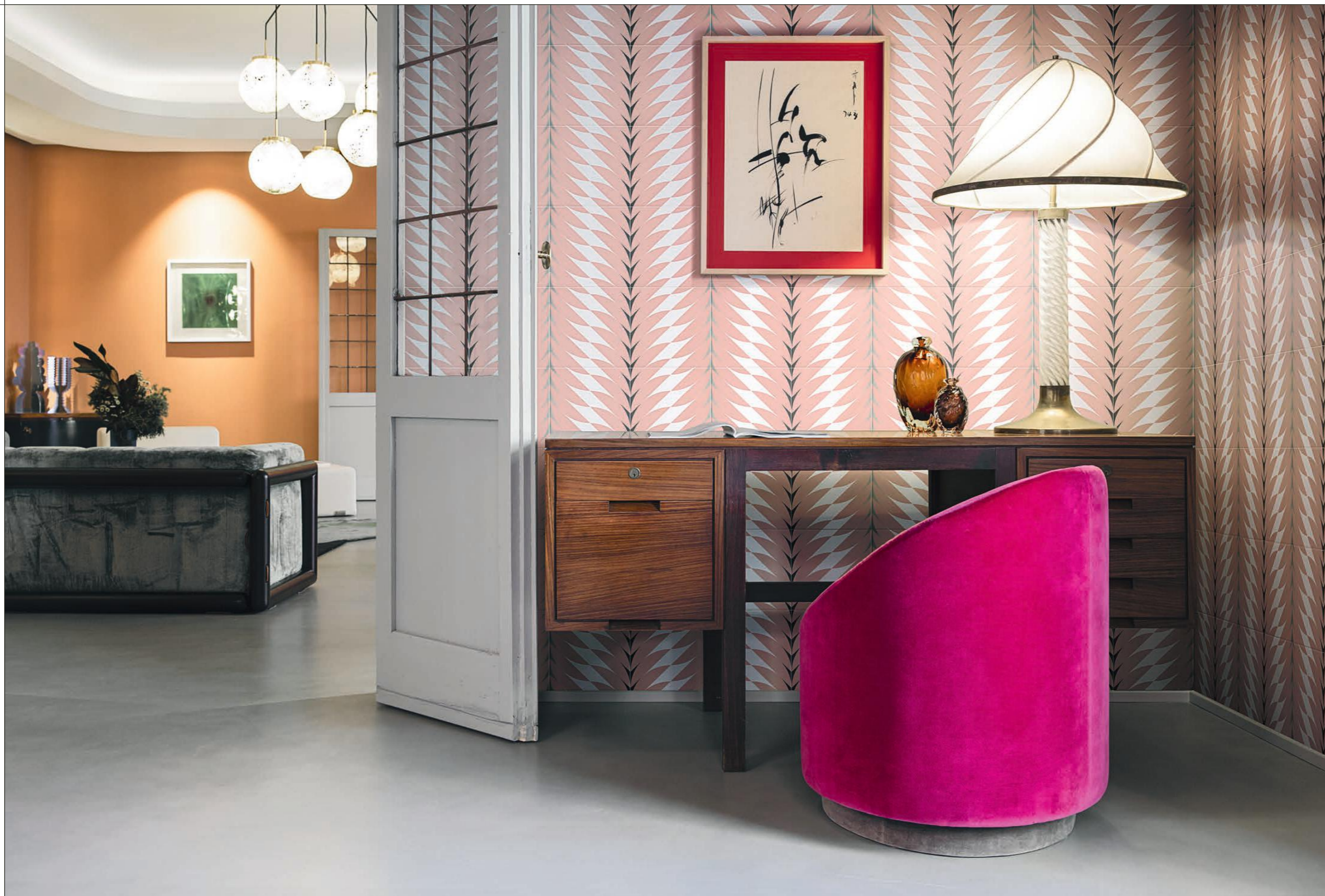
LIVING, FLEURS 3A-3B Rivestimento posa a campo pieno / Covering, all over layout